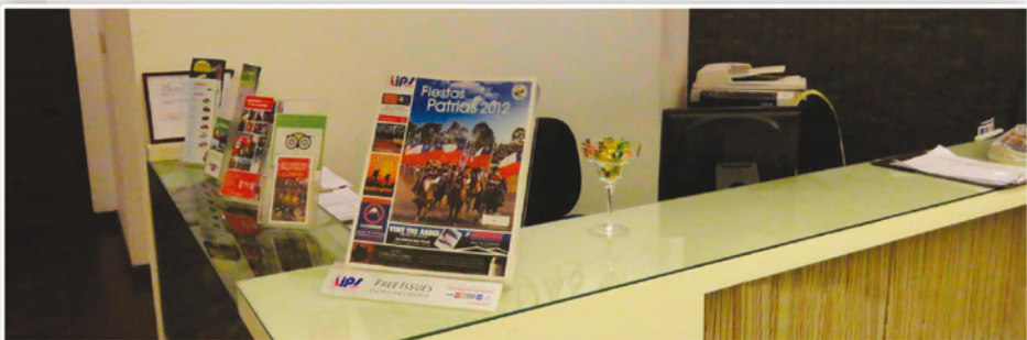
Entrega de dispensador de acrílico a la medida