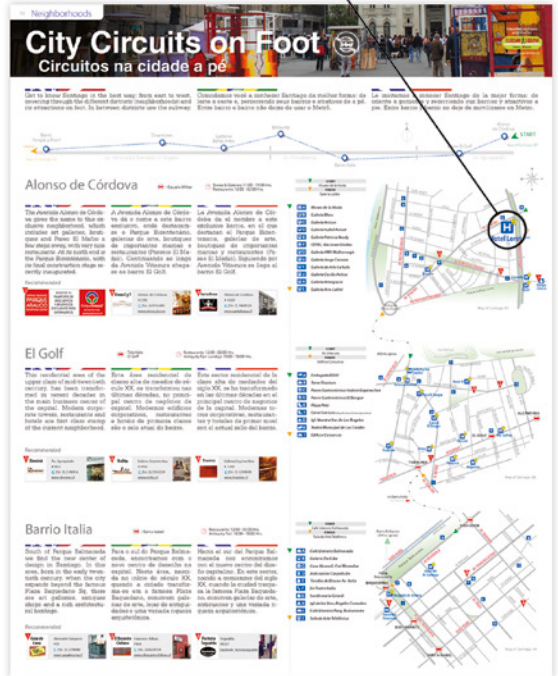
Ubicación geográfica y nombre del Hostel en mapa del barrio (sólo en disponibilidad de barrios publicados)